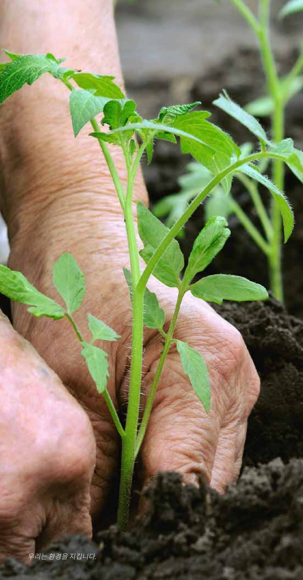
우리는 환경을 지킵니다.